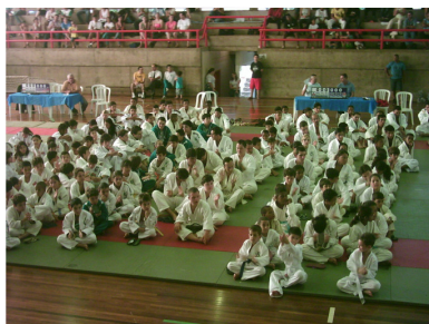
Concentração dos atletas