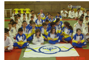
Equipe de Competição – Assoc. Ateneu – Mansor

REALIZAÇÃO: Associação Desportiva Ateneu-Mansor / Projeto Em Ação